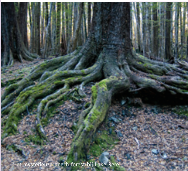
Het mysterieuze beech forest bij Lake Rere.